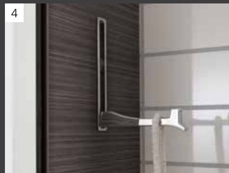
Der standardmäßig rechts und links am Spiegelschrank L8 eingebaute Haken ist eine praktisch-kreative Lösung für ein Plus an Stauraum.

Wählen Sie unter folgenden Waschtisch-Breiten und Dekoren Ihr persönliches Wunschbad aus.