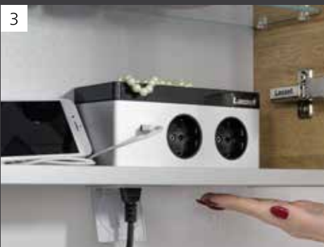
Innovative E-Box Magic mit USB-Anschluss, u. a. zum Aufladen Ihres Smartphones sowie einer spritzwassergeschützten Außensteckdose.