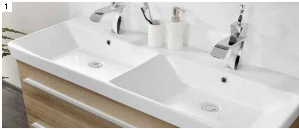
Highlight Traumpaar! Mit dem Keramik-Doppelwaschtisch macht es doppelt Spaß!